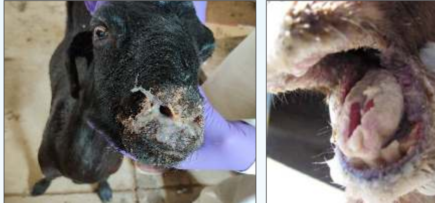
नाक से स्राव

बकरियों तथा छोटे मेमनों में अधिक प्रकोप। सुस्ती, नाक से स्राव, मुंह से बदबु, जीभ पर सफेद पपड़ी, सांस की समस्या, तेज बुखार, दस्त, मुंह में छाले।