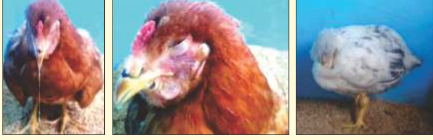
नाक से स्राव आँख में सूजन सुस्त पक्षी