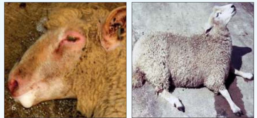
मुंह से झाग

खाना छोड़ना, अफारा, सुस्ती, दस्त लगना, चक्कर काटना। पेट दर्द के लक्षण जैसे बार-बार खड़े होना और बैठना, पेट पर लात मारना और कराहना। भेड़ों एवं छोटे जानवरों में अधिक प्रकोप। इस रोग से ग्रसित पशुओं में मृत्युदर काफी अधिक रहती है। कभी-कभी इस रोग से पशु की मृत्यु लक्षण आने के आधे घण्टे में भी हो सकती है।