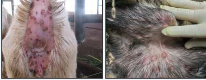
चमड़ी पर चितके व फफोले

तेज बुखार, नाक से गाढ़ा स्राव, खांसी, पेट के निचले हिस्से में जहां ऊन नहीं होती तथा कान पर फफोले जो बाद में सूखकर पपड़ी/चितके बन जाते हैं। मृत्यु दर 5-10 प्रतिशत या अधिक।