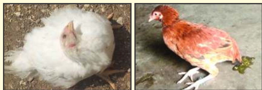
रोग ग्रसित मुर्गी की गर्दन घुमना हरे रंग के दस्त

तीन प्रकार की बीमारी विषाणु के स्ट्रेन के अनुसार। सांस की दिक्कत, हरे रंग के दस्त, आँख सूजना, गर्दन घुमना, अण्डे वाली मुर्गियों में अण्डे का उत्पादन गिरना तथा लंगड़ापन, मरे हुए पक्षियों में सांस की नली में लाली, प्रोवैन्ट्रीकुलस में खून के धब्बे व आंत में अल्सर मिलते हैं। इस बीमारी से मृत्यु दर काफी अधिक रहती है।